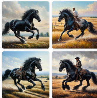
"un caballo sobre un jinete" Designer